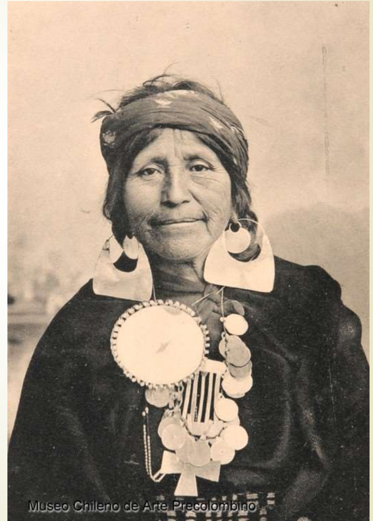
Museo Chileno de Arte Precolombino