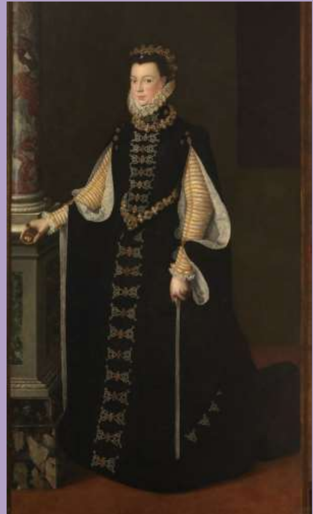
Isabel de Valois con retrato de Felipe II - Sofonisba 1560