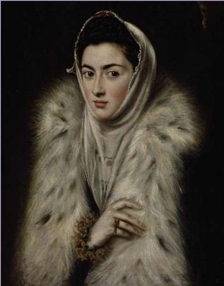
La Dama del Armiño (Infanta Catalina Micaela) 1590, atribuída erróneamente a El Greco y original de Sofonisba